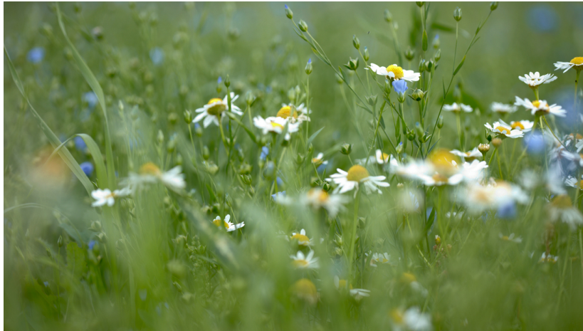
图3 一个彩色 jpg 图片的例子